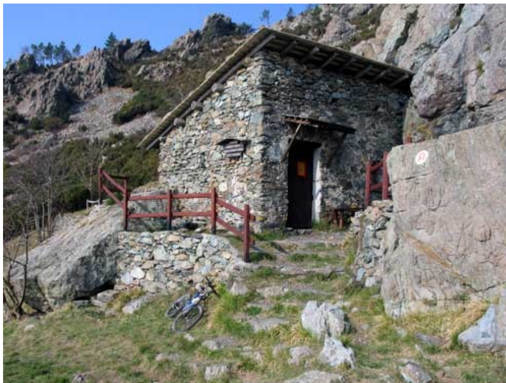
Il ricovero Scarpeggin

Evita la salita sulla sterrata dissestata ed è interessante anche perchè è stato appena ripulito e riparato. Ciclabile: 96%. Aprile 2008.